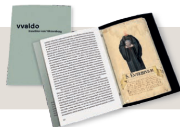
Bild Vorderseite: Reliquienkästchen mit Darstellung des hl. Eusebius auf der Unterseite, 1731, Stiftsarchiv St.Gallen.

Eusebius gehört zu den kaum bekannten Heiligen des Bodenseeraums. Seine Verehrung beschränkt sich auf Vorarlberg und die Ostschweiz. Irischer Herkunft, lebte er bis zu seinem Tod 884 als Rekluse im Klosterlein Viktorsberg. Selten lässt sich der Weg von der historischen Gestalt zum Märtyrer samt Kopfträgerlegende anhand schriftlicher Quellen und Reliquien sowie in der Kunst derart gut rekonstruieren.